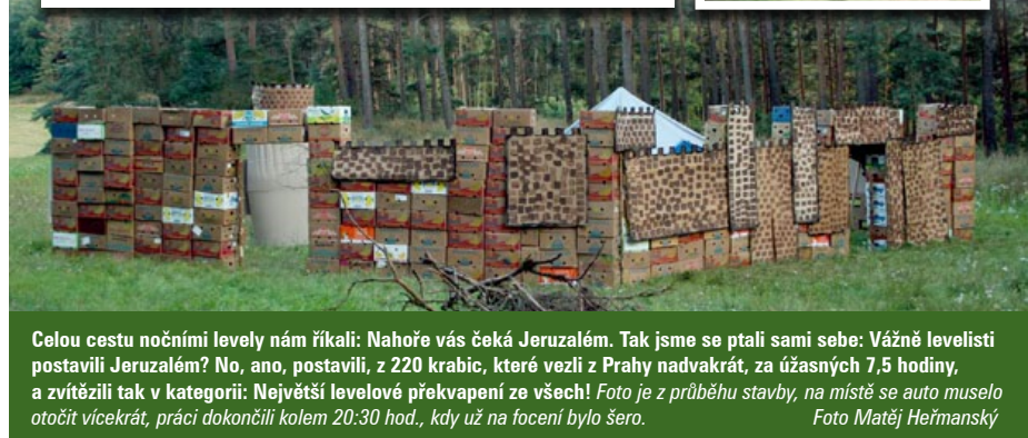
Celou cestu nočními levely nám říkali: Nahoře vás čeká Jeruzalém. Tak jsme se ptali sami sebe: Vážné levelisti postavili Jeruzalém? No, ano, postavili, z 220 krabic, které vezli z Prahy nadvakrát, za úžasných 7,5 hodiny, a zvítězili tak v kategorii: Největší levelové překvapení ze všech! Foto je z průběhu stavby, na místě se auto muselo otočit vícekrát, práci dokončili kolem 20:30 hod., kdy už na focení bylo šero.