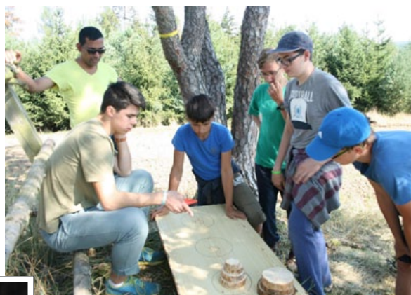
☛ Dopolnední levity, překážky a luštění dělá oddíl společně.

Nejvýraznější změnou letošních levitů bylo, že jsme „tábořili“ jinde. Upřímně: Většina dětí byla poněkud v šoku, protože, i když se to vědělo, všichni si neustále představovali to staré místo, kde jsme strávili několik krásných let. Každopádně jsme si bydleli, jedli i fungovali jinak. Nebudu po-