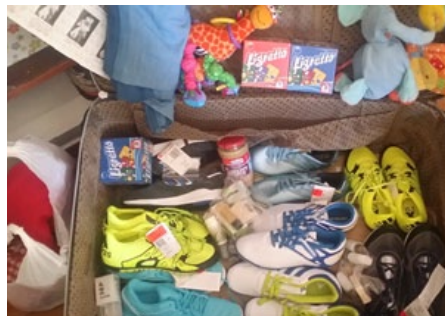
Dárky pro potřebné, adidas měl slevu tak jsme toho využili.

do začátku služby. Během celého týdne jsme si mohli uvědomovat, že Bůh opravdu zasahuje do životů uprchlíků a mění je.